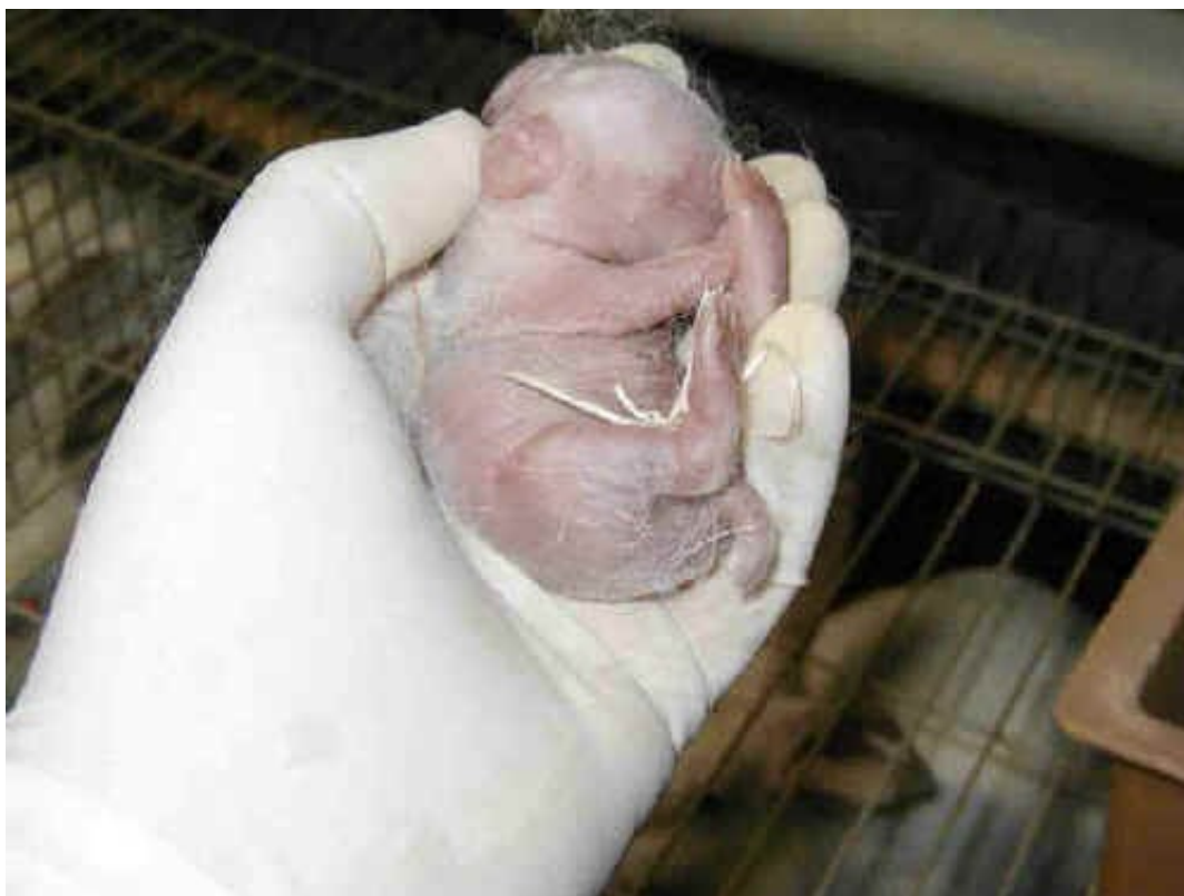
Coniglietto alla nascita